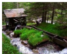
Tirolo Orientale: il profumo dei cembri