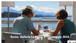
Sapori di Carinzia