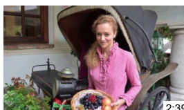
La Carinzia a tavola