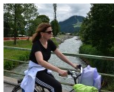
Tirolo Orientale: la ciclabile della Drava