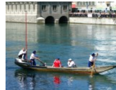
Zurigo, un tuffo nel lago