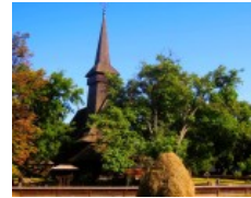
Nei parchi e sui laghi della capitale romena